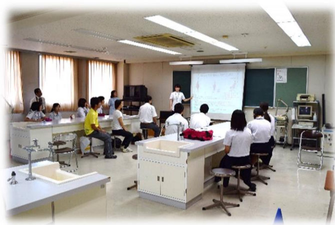
（講義体験）転倒に関する検査

入試の面接や小論文の対策については、ホームページに掲載されていますのでご活用ください。