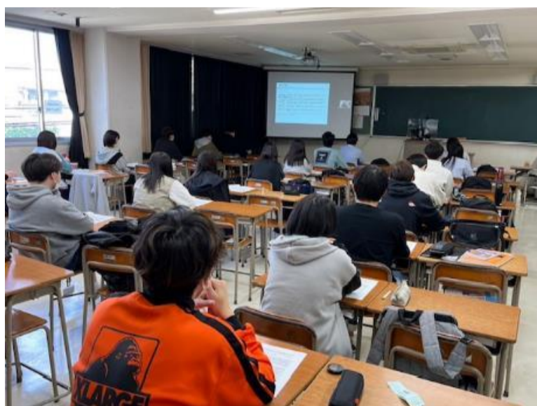
〈発表をオンラインで聴講する1年生〉